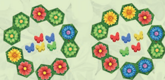
Для 4 игроков – 2 рынка по 5 тайлов

3 Сложите всех бабочек в мешок и как следует перемешайте. Выложите в середину каждого рынка столько бабочек, сколько тайлов на рынке.