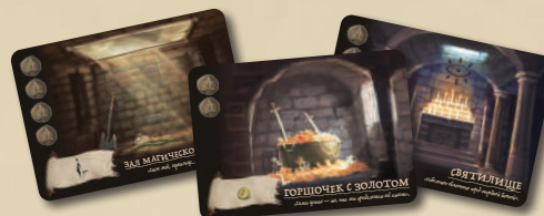
21 КАРТА ПОДЗЕМЕЛЬЯ