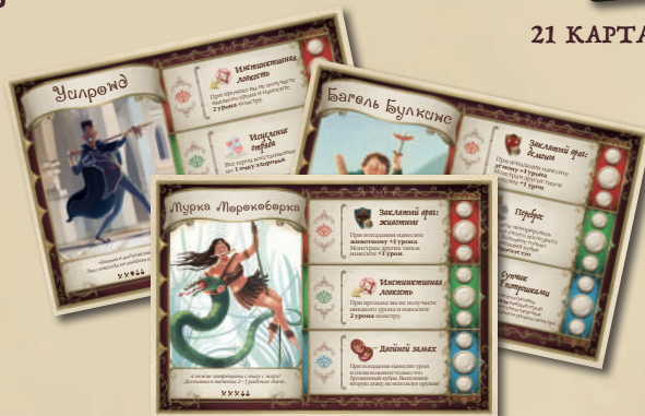
8 ПЛАНШЕТОВ ГЕРОЕВ