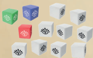
12 УНИКАЛЬНЫХ КУБИКОВ (3 ЦВЕТНЫХ КУБИКА ГЕРОЕВ + 9 БЕЛЫХ БОНУСНЫХ КУБИКОВ)