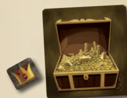
ЖЕТОН ВОЖАКА ЖЕТОН СУНДУКА