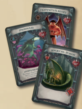
6 КАРТ БОССОВ