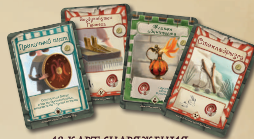
48 КАРТ СНАРЯЖЕНИЯ