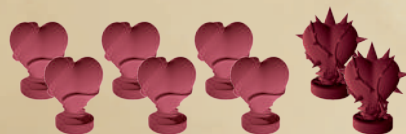
6 ФИШЕК ЗДОРОВЬЯ ГЕРОЕВ 2 ФИШКИ ЗДОРОВЬЯ МОНСТРА