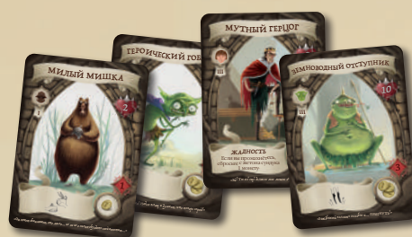
48 КАРТ МОНСТРОВ