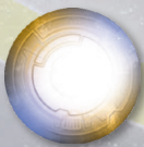
Лицевая сторона жетона