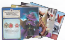
4 планшета капитанов