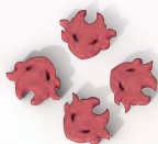
4 маркера пробуждения