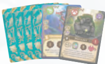
14 карт существ